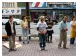
出展者打ち合わせ

来月は、上諏訪駅100周年記念イベントとの同時開催(10/21)が決定楽しみです。